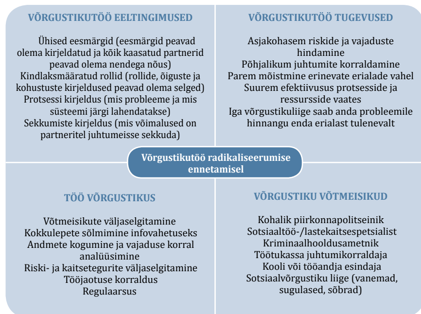
Joonis 2. Võrgustikutöö skeem radikaliseerumise ennetamiseks.

Võrgustikutööga on võimalik märgata riskikäitumist, sh radikaliseerumise ilminguid. Hästi toimiv võrgustik lihtsustab kõigi osaliste tööd. Erinevate osaliste teadmiste koondamine aitab varakult märgata riskifaktoreid, et hoida ära radikaliseerumist. Radikaliseerumise ennetamine võrgustikutöö kaudu eeldab, et kõik võrgustikus mõistavad ühtmoodi radikaliseerumise olemust ning info jagamise olulisust. Olles ise esimene riskikäitumise märkaja, peab võrgustiku liige olema valmis võtma vastutust ja initsiatiivi juhtumiga tegelda, kaasates olulisi võrgustikuliikmeid. Tuleb mõista, et varajase märkamise puhul on oluline olla ise koheselt info edastajaks ja mitte jääda ootama, et keegi teine probleemi märkab.