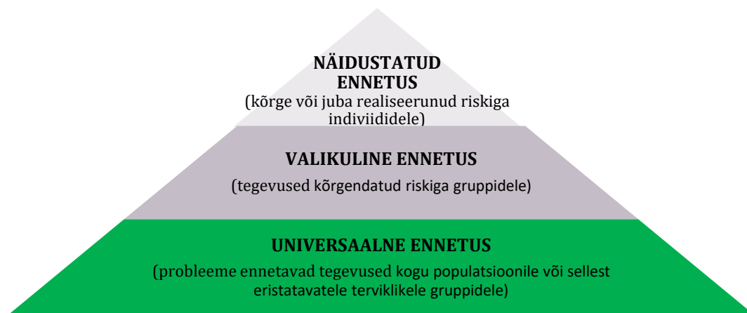
Joonis 1. Ennetuse eesmärkidest ja sihtrühmadest tulenev kolmetasandiline jaotus. 16

Ennetust on keeruline defineerida ning selle mõiste sisu ongi kokkuleppeline. Ennetuse olemuse selgemaks lahtimõtestamiseks saab välja tuua ennetuse eesmärkidest ja sihtrühmadest tuleneva kolmetasandilise jaotuse, mida valdavalt aktsepteeritakse tervikliku raamistikuna kõigile ennetuse vormidele ja neid kirjeldavatele definitsioonidele. Politsei ennetustöö tugineb samuti neil tasanditel.