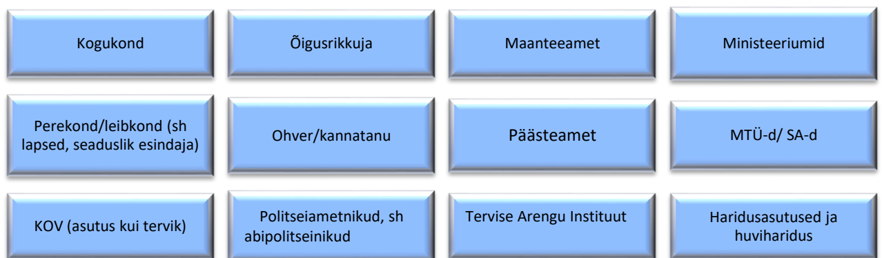
Joonis 3. Ennetustegevuse seotud osapooled.

Ennetustegevus on koostöötegevus ning järgmisel joonisel (nr 3) on toodud ennetustegevusega seotud osapooled. Osapooltena on käsitletud inimesi, grupe või asutusi, kes mõjutavad või keda mõjutab ennetustegevuse eesmärkide saavutamine. Tegemist ei ole ammendava loeteluga, lähtuvad situatsioonist võib olla kaasatud rohkem.