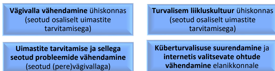
Joonis 6. PPA prioriteetsed valdkonnad aastani 2020.

Kontseptsioonis on defineeritud politsei ennetustöö mõiste ning määratletud selle korraldamine. Vajalik on määratlus, millised on politsei jaoks prioriteetsed teemad ning eristada teemad, millega saabki tegeleda ainult politsei, st politseil on juhtroll. Ennetuses suunatakse põhitähelepanu sellistele valdkondadele, mille puhul inimeste elu või tervis on suuremas ohus, olenemata sellest, kes on teema eestvedaja. Ülejäänud PPA ennetusvaldkondades sõltub ennetustöö rõhuasetus konkreetse piirkonna probleemidest ajahetkel ning nendesse panustamine on endiselt vajalik. Järgneval joonisel nr 6 on toodud politsei ennetustöö prioriteetid: