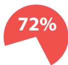
Joonis 15. Registreeritud vägivallakuritegude arv

Vägivallakuritegude enamiku moodustab kehaline väärkohtlemine